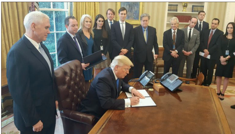
U.S. President Donald J. Trump signing an Executive Order giving conditional approval for Energy Transfer Partners' Dakota Access Pipeline for Bakken crude and TransCanada's Keystone XL pipeline to bring Canadian diluted bitumen to refineries in Texas.

POSTED BY: RICHARD QUARISA SEPTEMBER 6, 2018