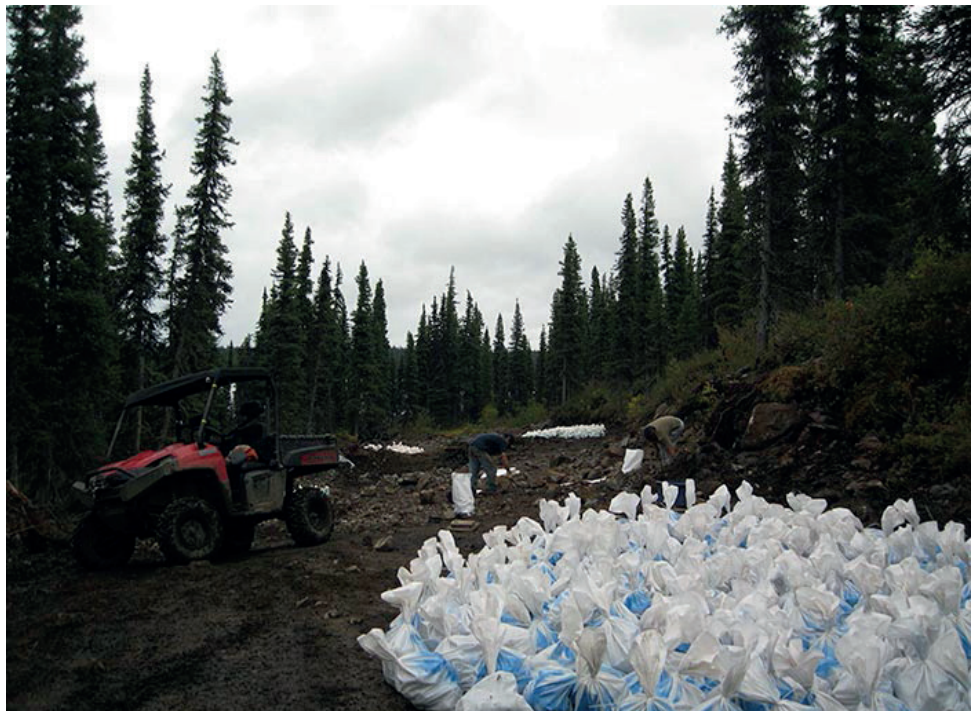
Arbeiter entnehmen eine Grossprobe ("bulk sample") vom Eldor REE Projekt von Commerce Resources in der Region Nunavik (Quebec).

Die Aktien von Commerce werden derzeit zu einem Kurs von $0,06 gehandelt, die 52-Wochen-Spanne liegt zwischen $0,05 und $0,10. Das Unternehmen verfügt über eine Marktkapitalisierung von $18 Mio.