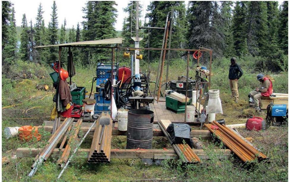
Ein Bohrstandort auf dem Ashram REE Projekt von Commerce Resources aus dem Jahr 2011.

Das Projekt enthält gemäss der Schätzung aus dem Jahr 2013 eine "indicated" Ressource in Höhe von 48,4 Mio. t mit Gehalten von 197 g/t Tantal-Oxid und 1.610 g/t Niob-Oxid, was 21 Mio. Pfund Tantal-Oxid und 171,5 Mio. Pfund Niob-Oxid entspricht. Darüberhinaus beinhaltet das Projekt eine "inferred" Ressource im Umfang von 5,4 Mio. t mit Gehalten von 191 g/t Tantal-Oxid und 1.760 g/t Niob-Oxid, also 2,2 Mio. Pfund Tantal-Oxid und 21,2 Mio. Pfund Niob-Oxid.