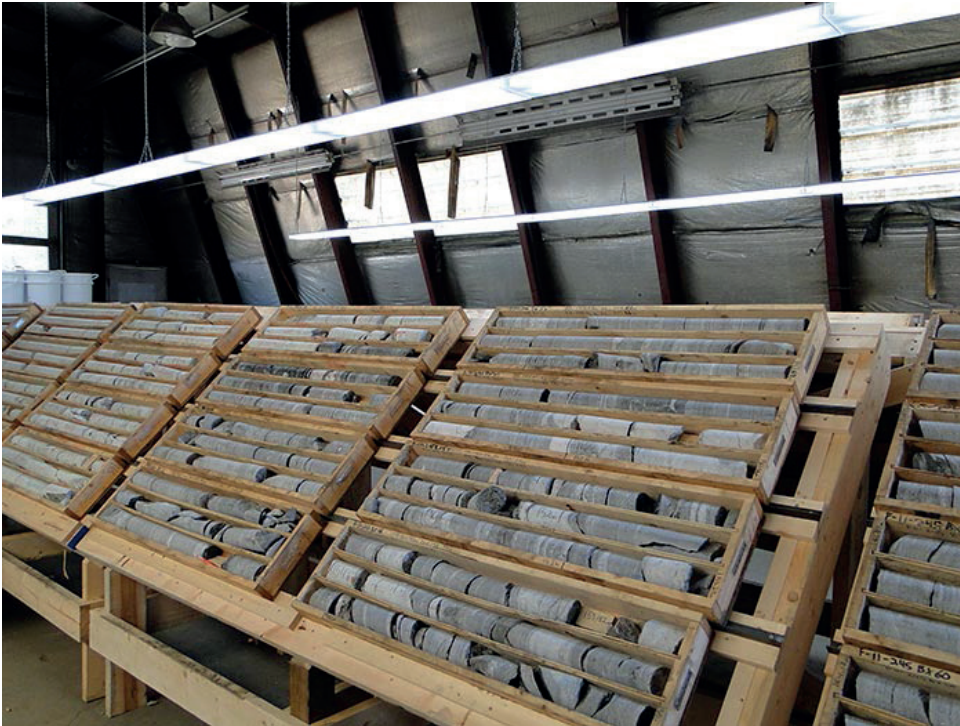
Bohrkerne vom Blue River Tantal-Niob-Projekt von Commerce Resources, 250 km nördlich von Kamloops (British Columbia).